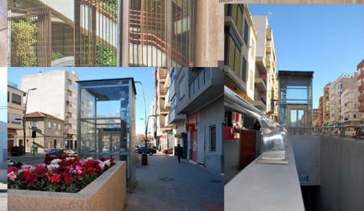
PARKING GRAN AVENIDA DE ELDA