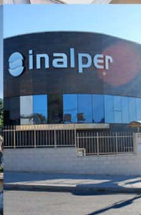
NAVE INDUSTRIAL INALPER