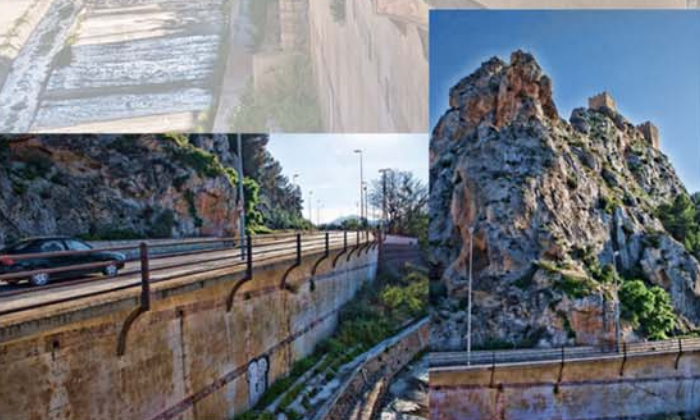
MURO Y PASARELA PARA EL VINALOPÓ EN SAX